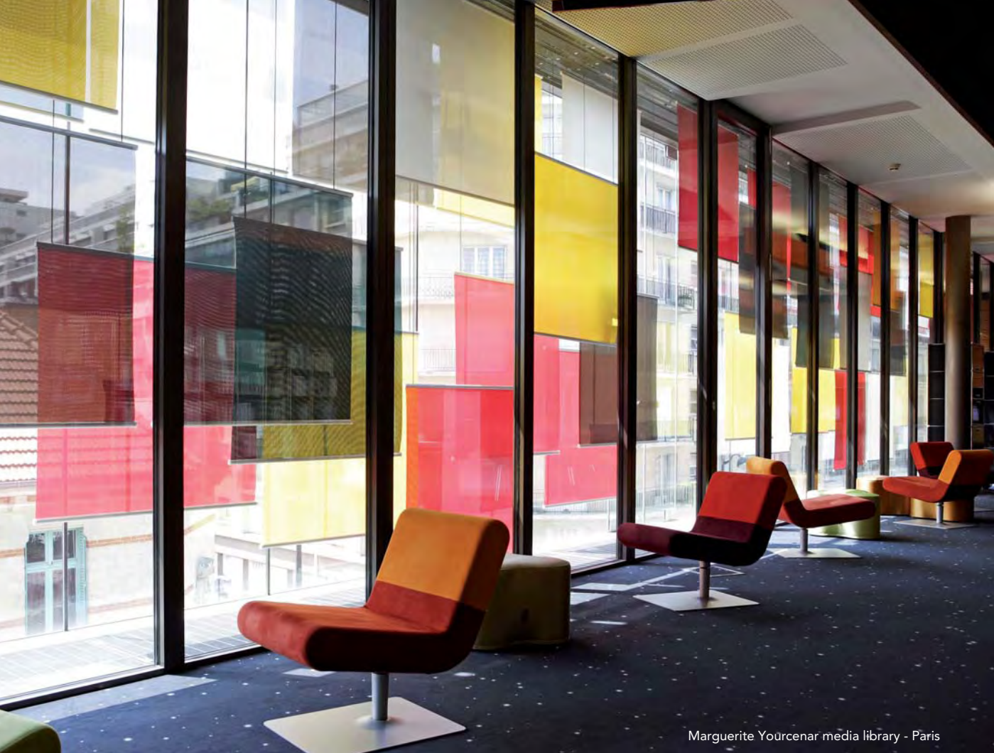
Marguerite Yourcenar media library - Paris