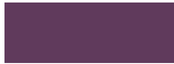
7554 - Grosella