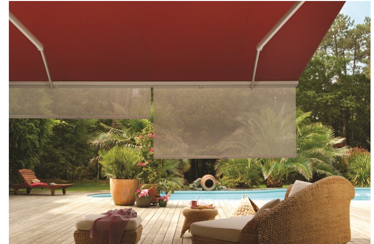
Lambrequin enroulable / Sunvision®