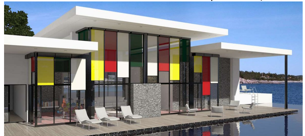
Stores extérieurs / Sunworker®