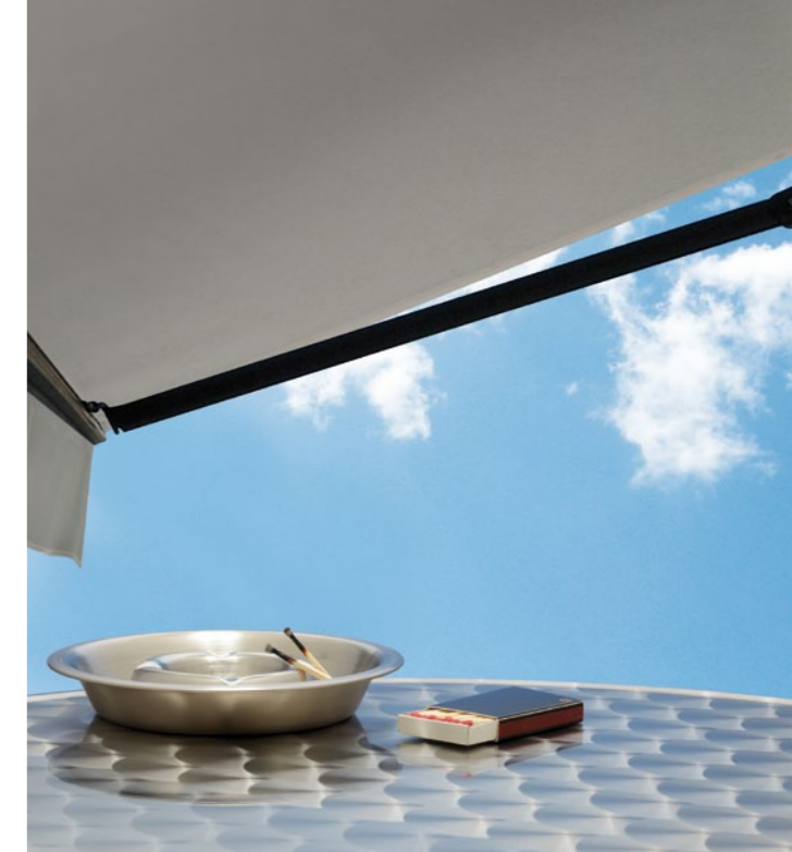
STRUCTURE DE FIBRE NON-FEU

Conforme aux normes de sécurité non-feu, elle est constituée de fibres ignifugées à cœur pour une sécurité maximale. Ce haut niveau d'exigence fait d'Alto FR la toile de référence pour les cafés, les restaurants mais également les hôtels ou les hôpitaux.