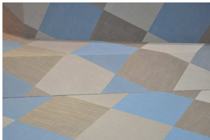
Un stand à l'image du potentiel esthétique de cette 1ère collection de revêtements de sols